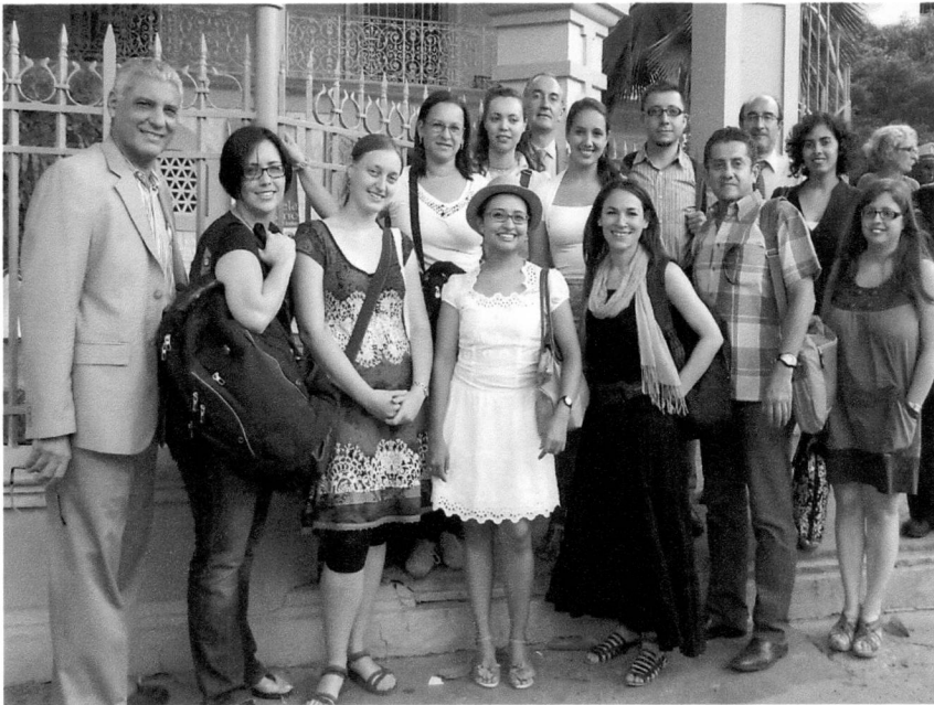
Vista General de los delegados de universidades Europeas, Colombia, Costa Rica y Panamá