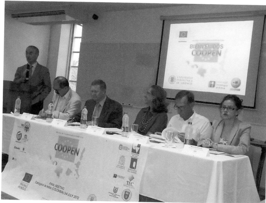
Acto de Inauguración, Reunión final del Proyecto COOPEN, Unión Europea.