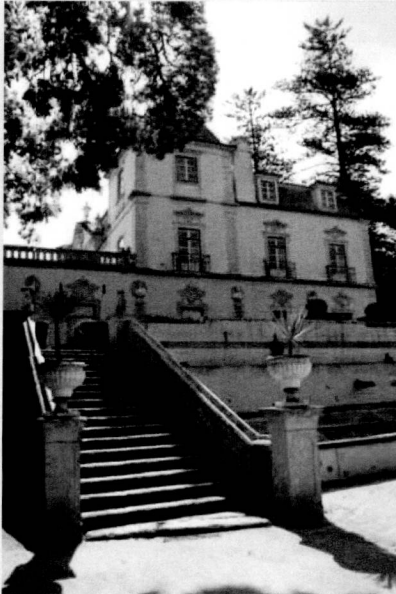
Sede do INA