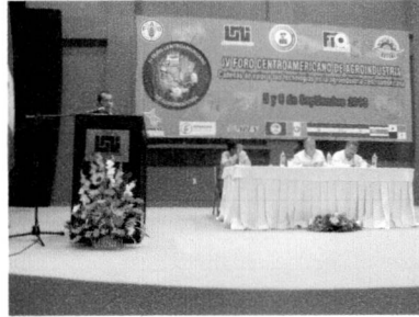
Participación en el 4to Foro Centroamericano de Agroindustria (Presentación en Mesa Temática y Panel Temático - 05/09/13)