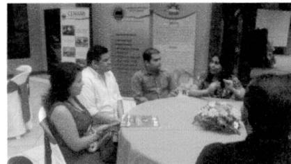
Cena de Bienvenida 05/09/13