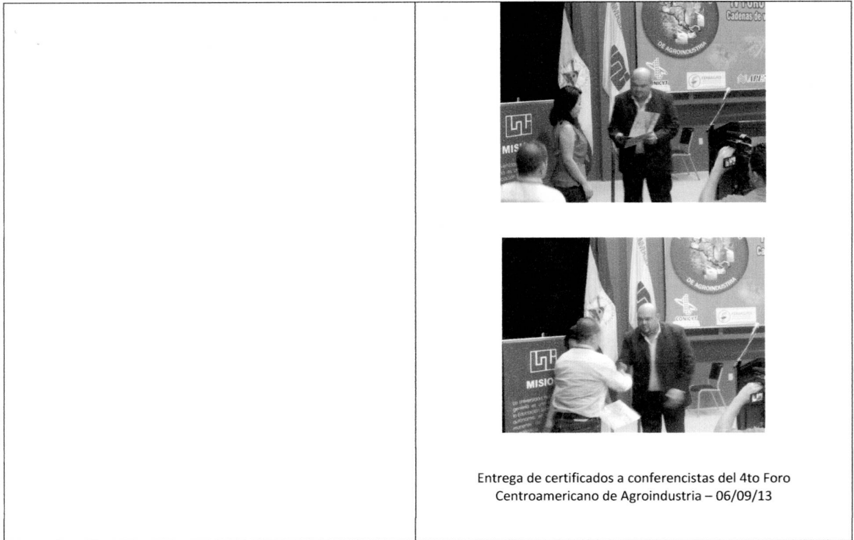
Entrega de certificados a conferencistas del 4to Foro Centroamericano de Agroindustria – 06/09/13