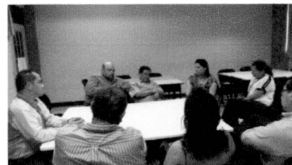
Participación Reunión de miembros de la Red Centroamericana de Agroindustria (Elección para Sede del V Foro – 14/07/12)