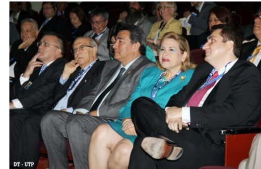
V Encuentro de Redes Universitarias en Panamá