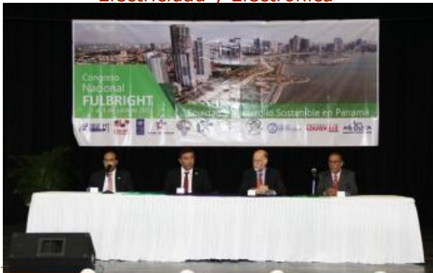
Congreso Nacional de Fulbright