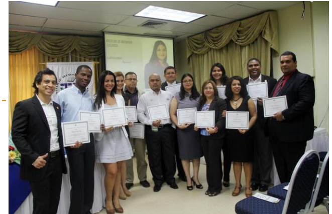
Investigadores de la UTP publican artículo en revista Internacional