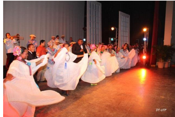
Semana de la Cultura