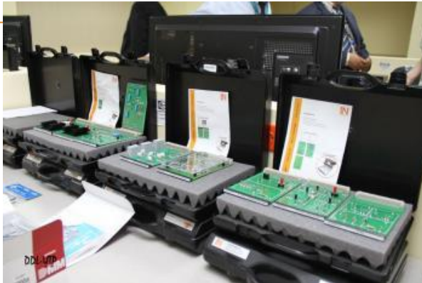
UTP y COPA inauguran laboratorio de Electricidad y Electrónica