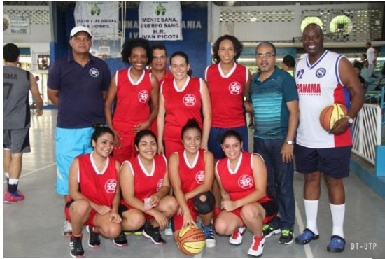
UTP gana campeonato en Torneo Interuniversitario de Baloncesto en la categoría femenina