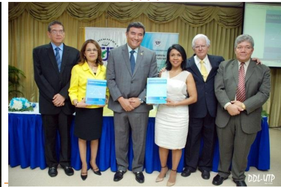
Presentación del libro "Estadística General Aplicada"