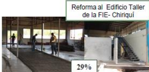
Reforma al Edificio Taller de la FIE- Chiriquí