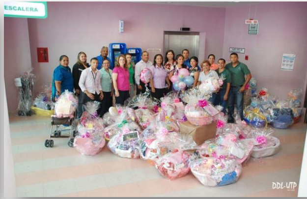
Entrega de canastillas