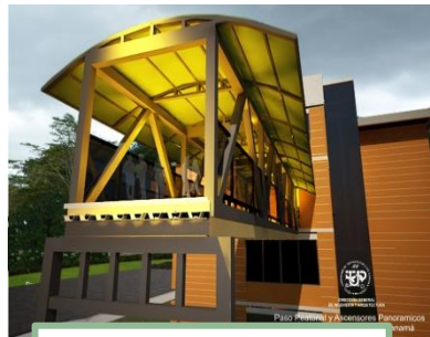
Diseño preliminar Proyecto Puente Peatonal