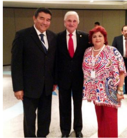
Participación en Reunión De Rectores, Florida, E.U.