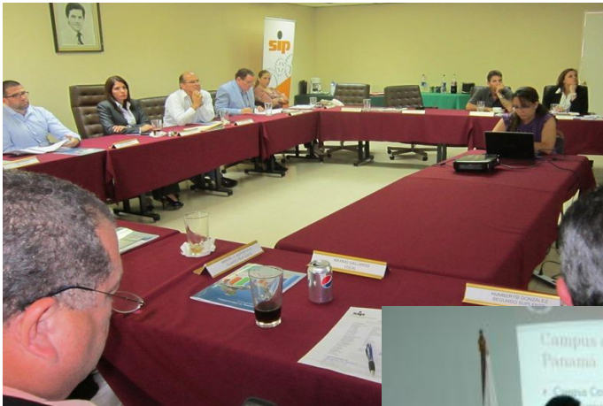
Reunión en el SIP