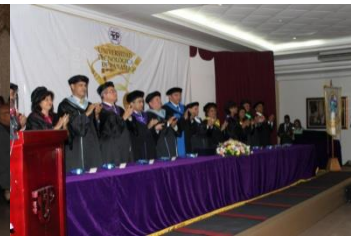
C. R. de Panamá Oeste 18 de junio