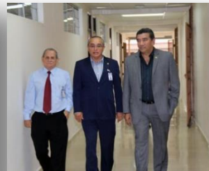
Centro Regional de Panamá Oeste Abril 17