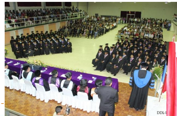
C. R. de Coclé 20 de junio