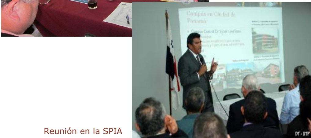
Reunión en la SPIA