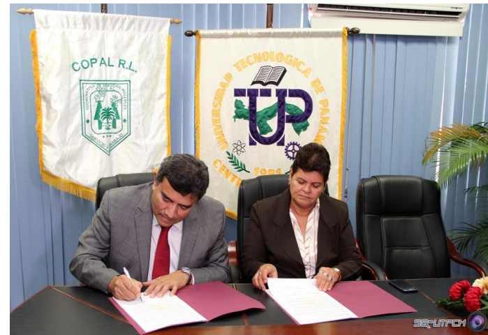
Cooperativa de Servicios Múltiples Corozo Palmito (COPAL)