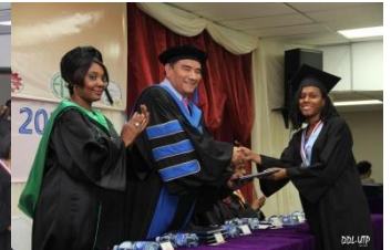
C. R. de Colón 19 de junio