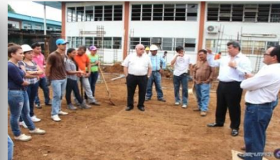
Centro Regional de Chiriquí Mayo 24