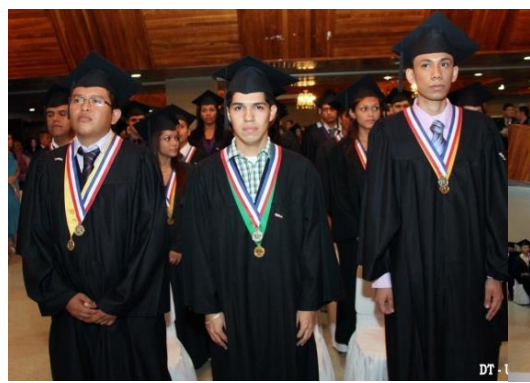
C. R. de Veraguas 26 de junio