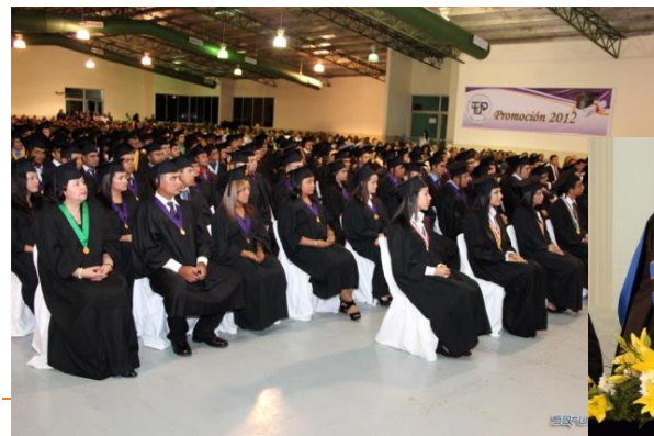
C. R. de Chiriquí 27 de junio