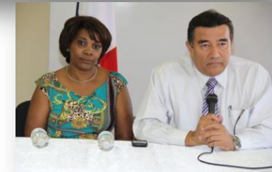
Centro Regional de Colón Abril 23