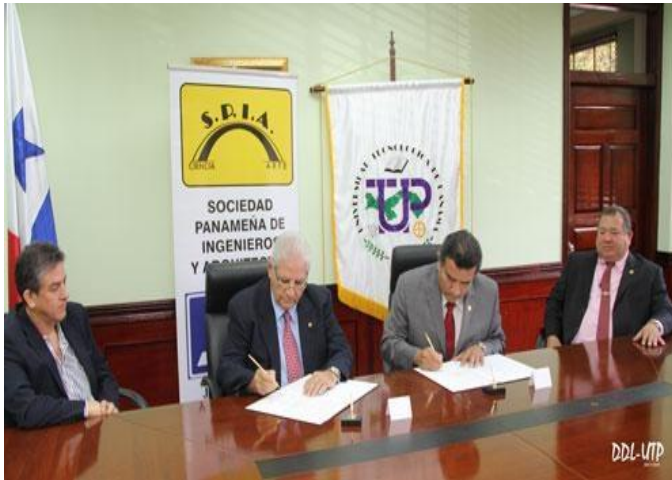
Sociedad Panameña de Ingenieros y Arquitectos