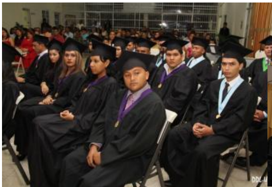
C. R. de Bocas del Toro 30 de agosto