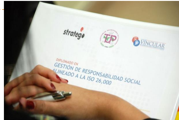
Tercer diplomado en Responsabilidad Social