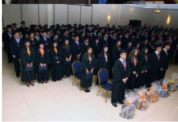
C. R. de Azuero 21 de junio