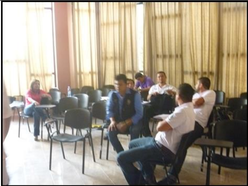
Figura 2: Reunión de Presidentes de Federación (FEUCA)