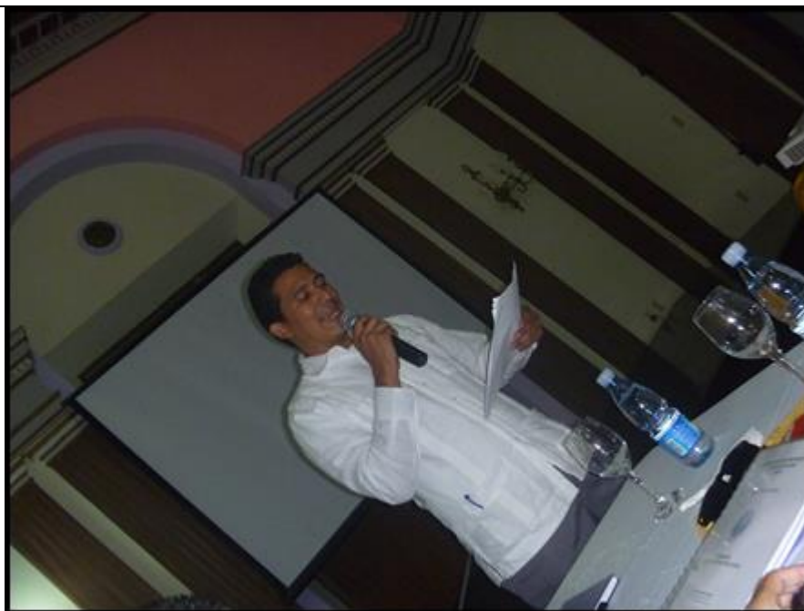
Figura 3: Candidato de Nicaragua