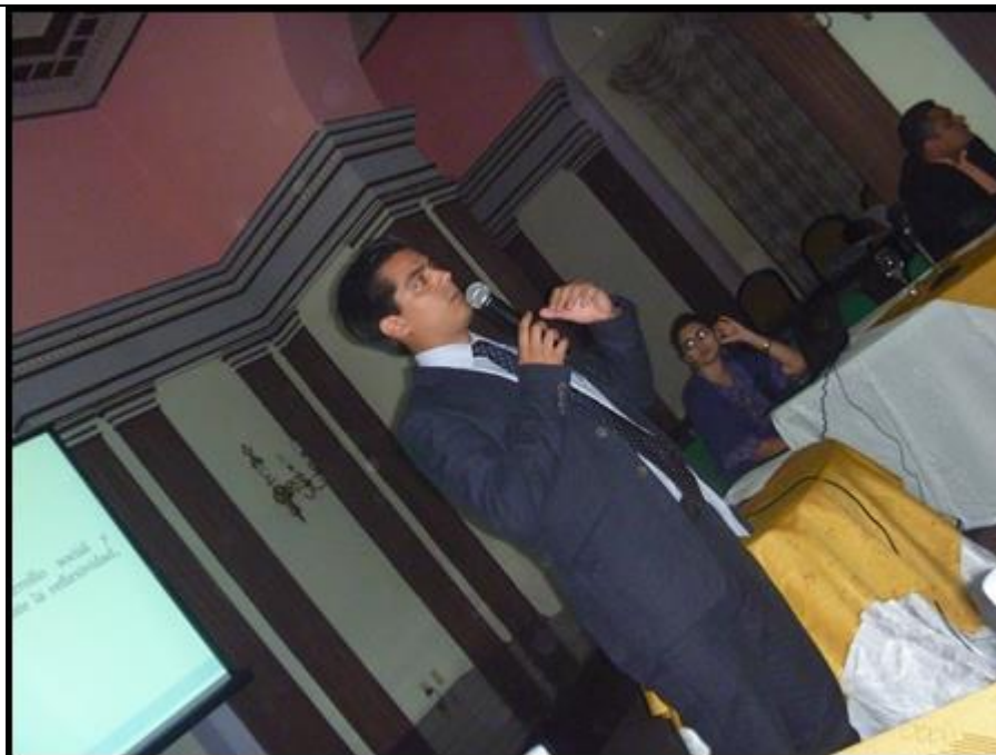
Figura 4: Candidato de Costa Rica