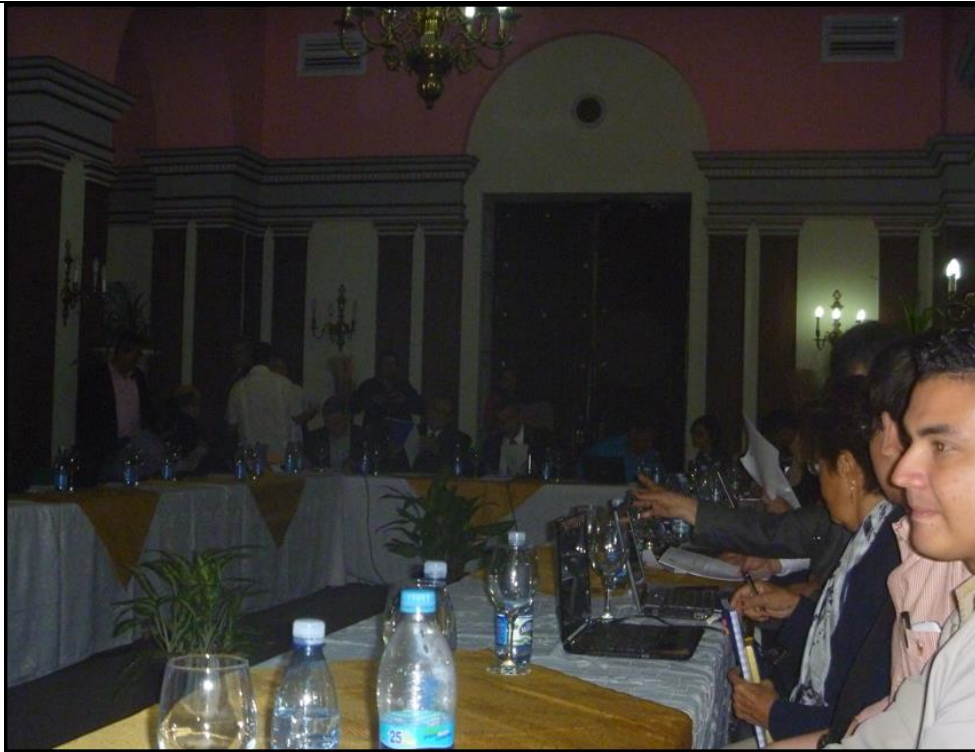
Figura 1: Sesión Ordinaria del CSUCA