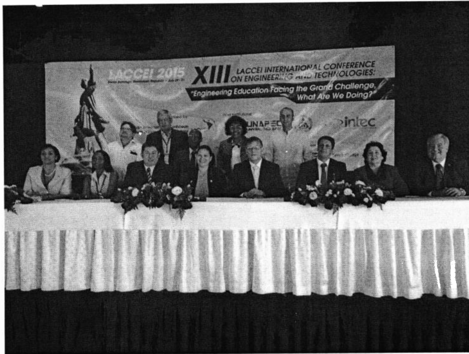
Junta Directiva LACCEI 2016