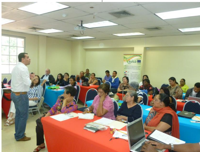
Taller “Finanzas para Emprendedores”