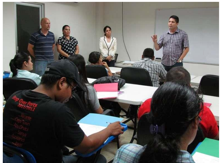
Diplomado “Higiene y Seguridad Ocupacional”

El cuadro a continuación presenta un detalle de la cantidad de acciones de capacitación desarrolladas y la participación, según la procedencia de los asistentes. Estas cifras revelan que la