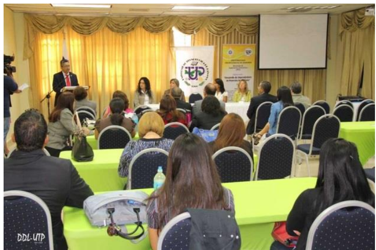
Diplomado “Desarrollo de Emprendedores en Proyectos Innovadores”

Como resultado de estos programas, durante el año 2014 las unidades académicas, administrativas y de investigación impartieron 283 acciones de capacitación, en modalidades de seminarios, talleres, cursos, jornadas, conferencias, charlas y diplomados, entre otros.