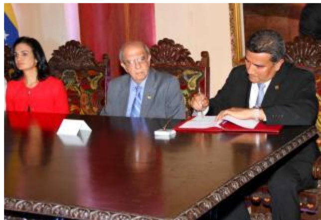
Ministerio de Relaciones Exteriores