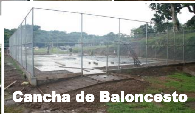
Cancha de Baloncesto