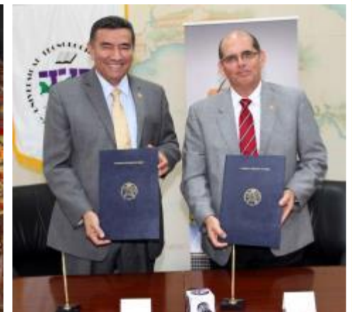
Sindicato de Industriales de Panamá