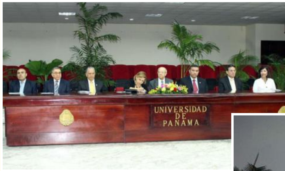
Inauguración Foro sobre Educación Superior

Panel de Rectores: Políticas Universitarias: "Reflexión y Prospección Hacia el Desarrollo Humano y Científico del País"