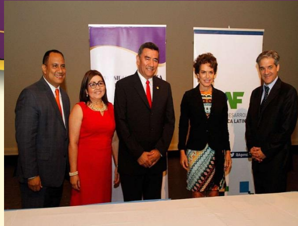
Banco de Desarrollo de América Latina CAF