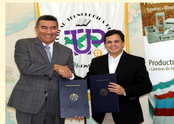
Empresa Grupo Industrial Canal