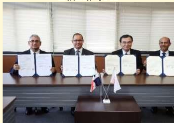
Universidad de Chiba