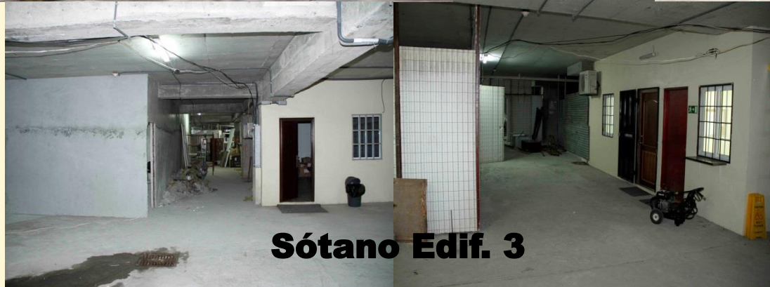
Sótano Edif. 3