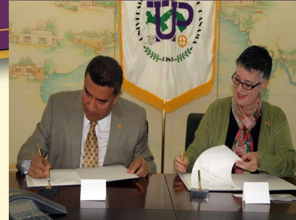
Wilkes University - USA