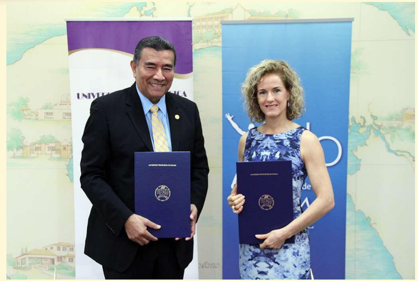
Fundación Gramo Danse