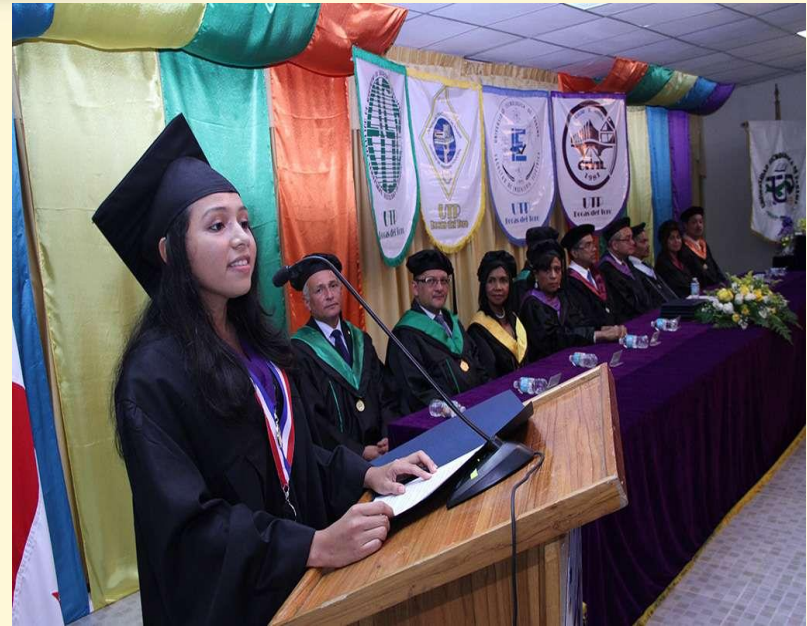
C. R. de Bocas del Toro