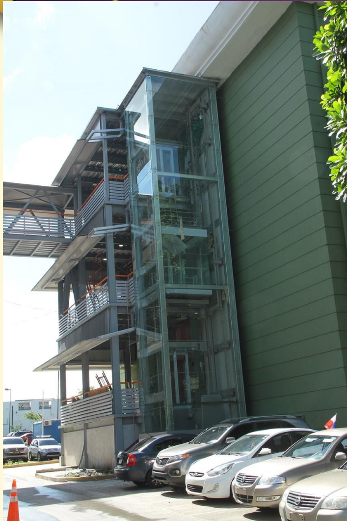
Ascensor Edif. 3 y Edif. 1