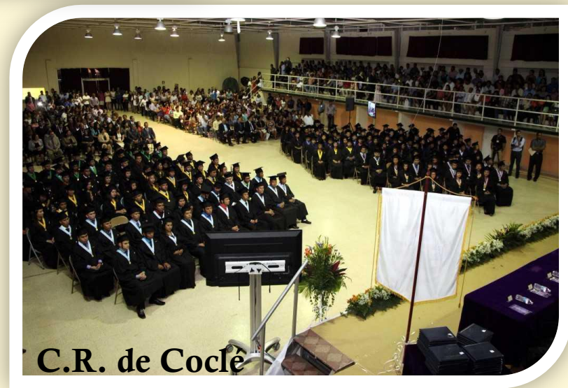
C.R. de Coclé