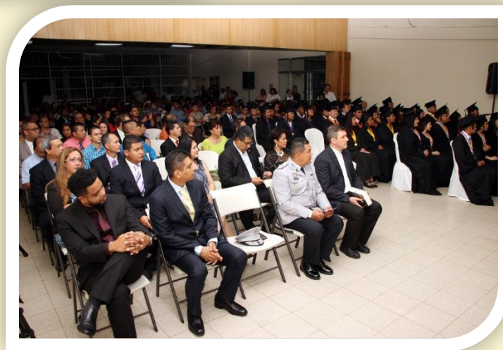
C.R. de Bocas del Toro