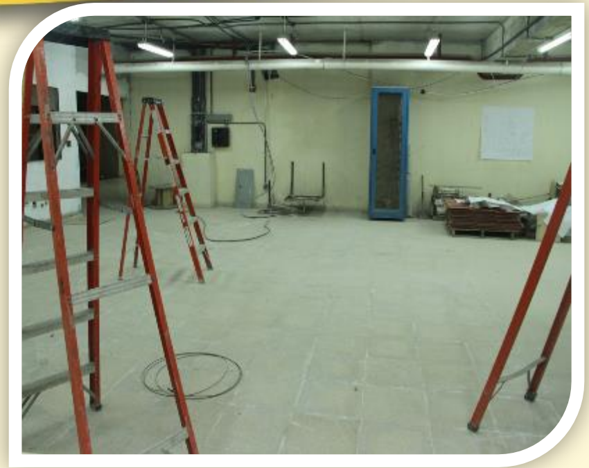
Habilitación del Sótano Edif. 3