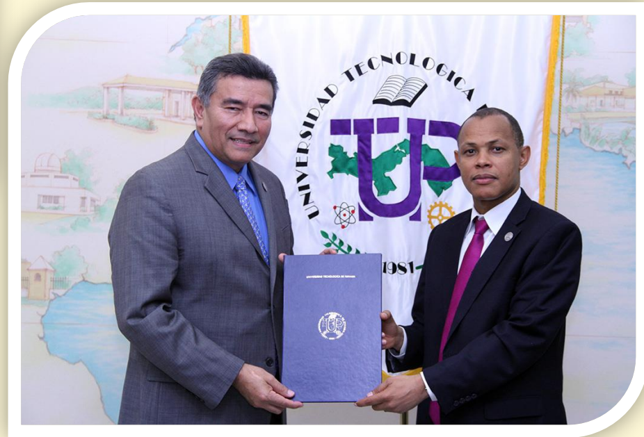
Computers & Structures, Inc. CSI