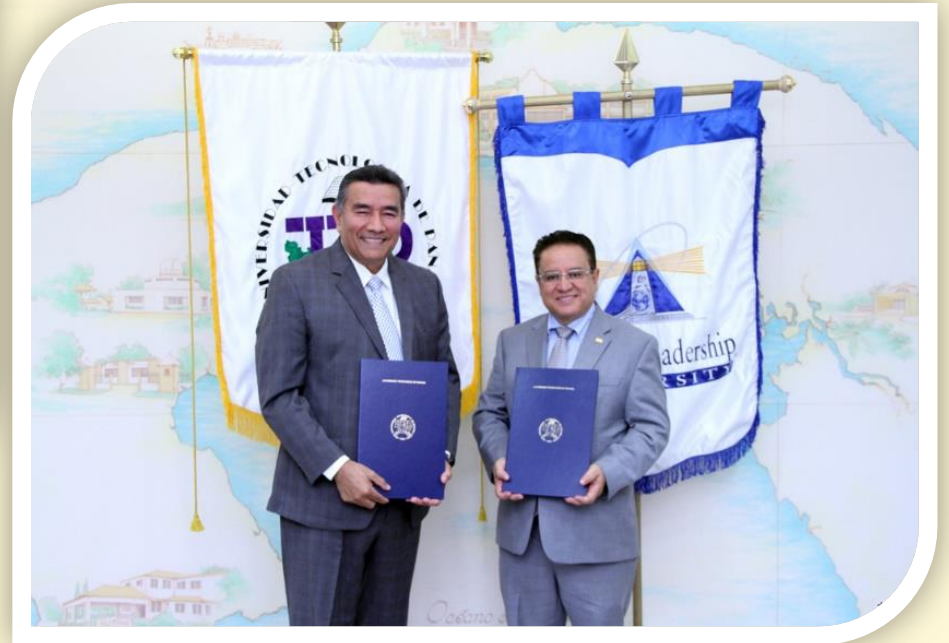
Quality Leadership University