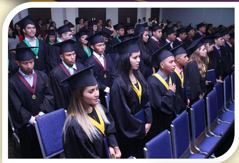
C.R. de Veraguas