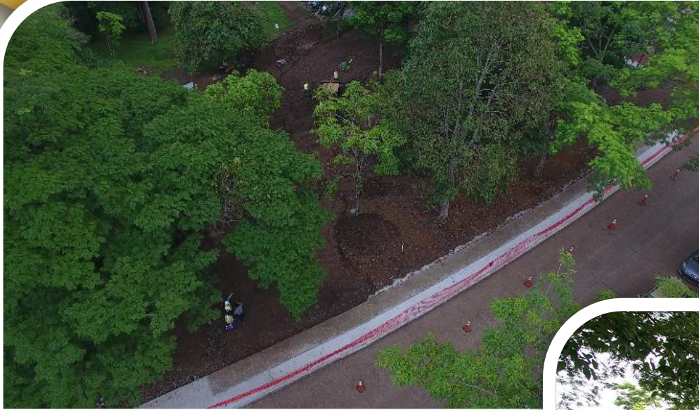
Ampliación de Aceras - Fase 3