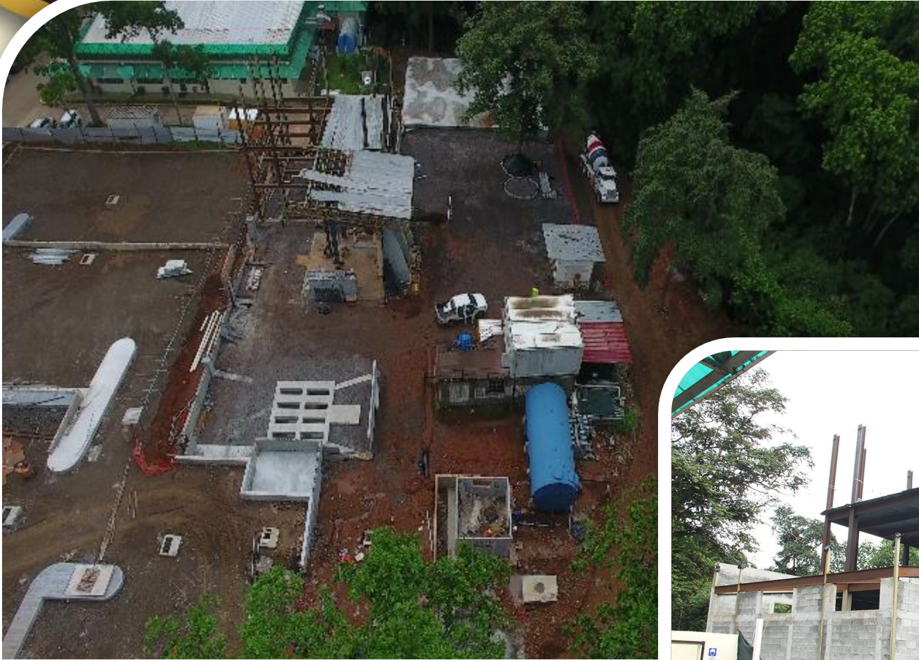
Laboratorio de Estructura