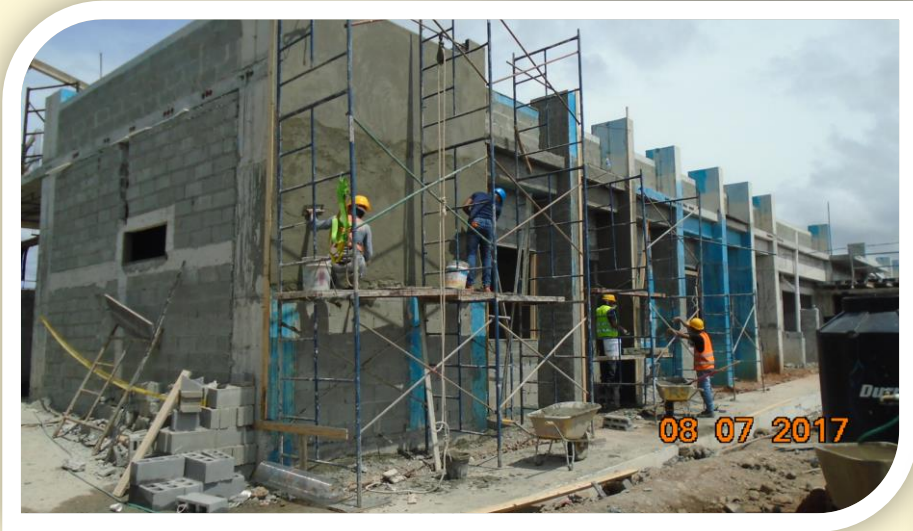
C.R. de Panamá Oeste