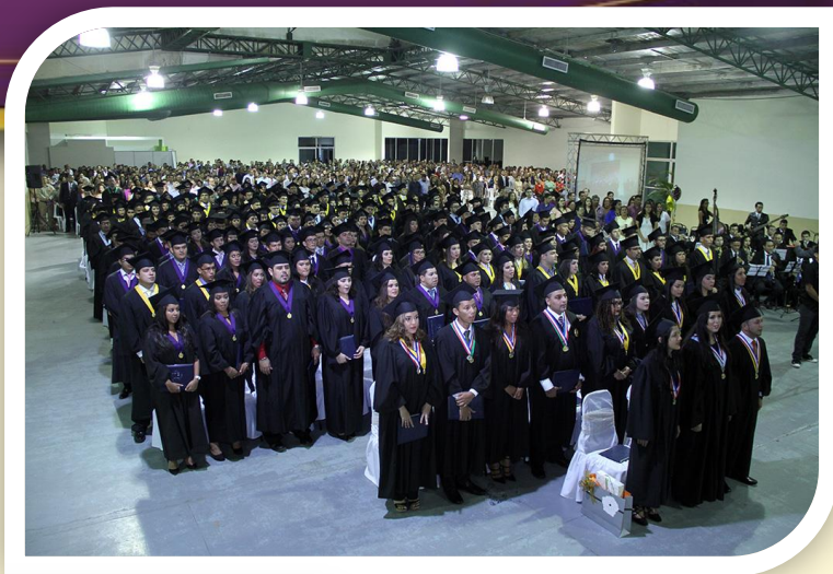
C.R. de Chiriquí