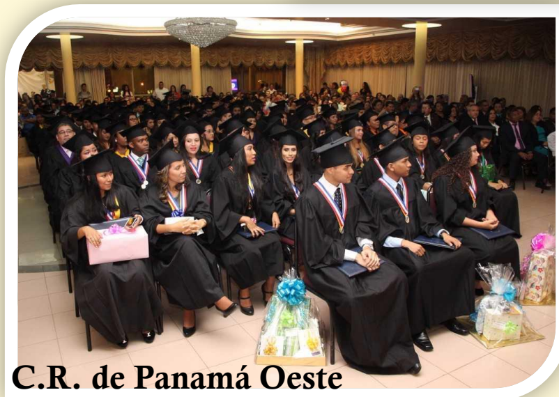
C.R. de Panamá Oeste