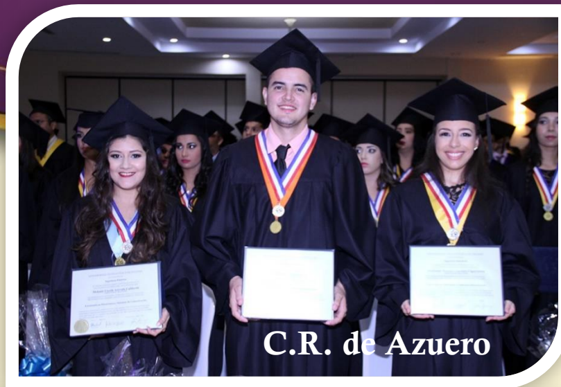
C.R. de Azuero