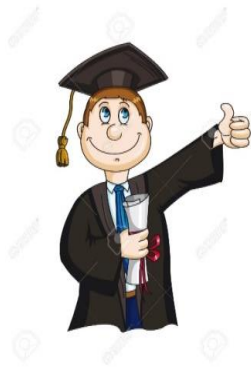
DIAGRAMA DE PRUEBA DE UBICACIÓN Y EGRESO DE LOS ESTUDIANTES DE POSTGRADO

Realizará alguna de las siguientes pruebas diagnósticas