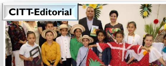
Presentación de Libro Ganador de Literatura Infantil: "La Piña María y otras canciones".