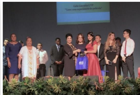
Gala Literaria 2019.