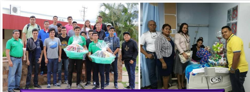
Entrega de Canastillas y Víveres.