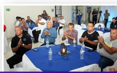
Agasajo - Día del Agente de Seguridad.