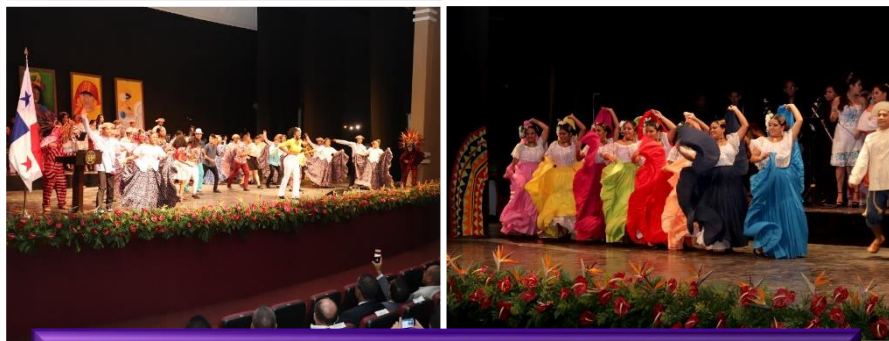
Gala Cultural, "Esencia de mi Tierra".