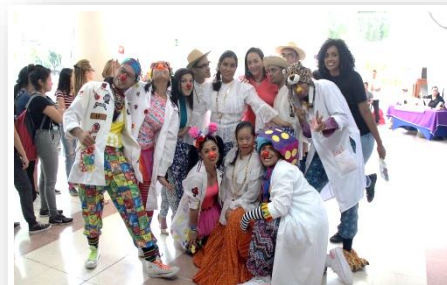
II Feria de Voluntariado.