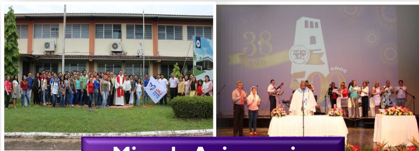
Misa de Aniversario.