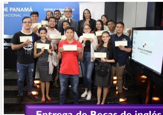
Entrega de Becas de inglés para Universidades Oficiales