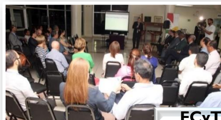
FCyT Conversatorio "Café Mediación y Cultura de Paz" en la UTP.