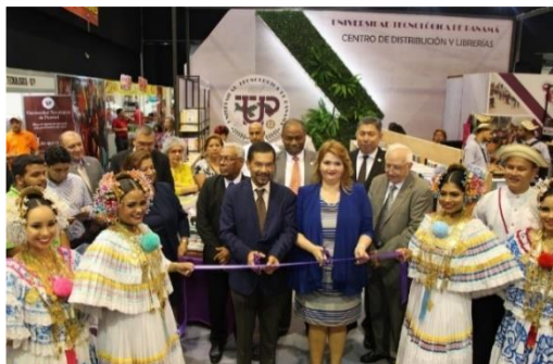
Inauguración de Stand en la XV FERIA Internacional del Libro.