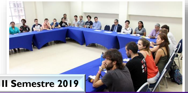
II Semestre 2019