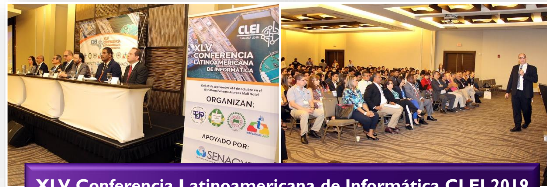
XLV Conferencia Latinoamericana de Informática CLEI 2019

Evento que se desarrolla con el objetivo de fomentar el desarrollo de la informática en la región y apoyar en la transferencia tecnológica, innovación, investigación y docencia en informática.