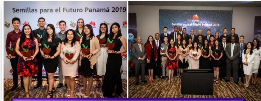
Estudiantes Ganadores de Semillas para el Futuro Panamá 2019.