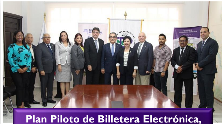
Plan Piloto de Billetera Electrónica, para estudiantes.