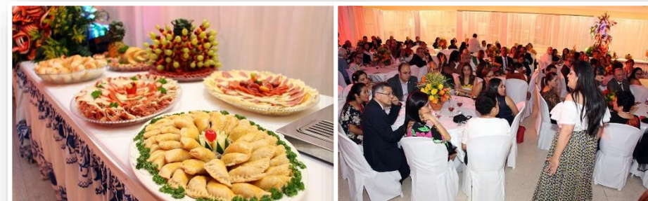
Noche de poemas, música, vinos y queso.