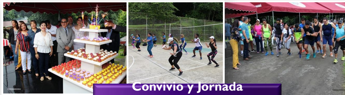
Convivio y Jornada Deportiva.