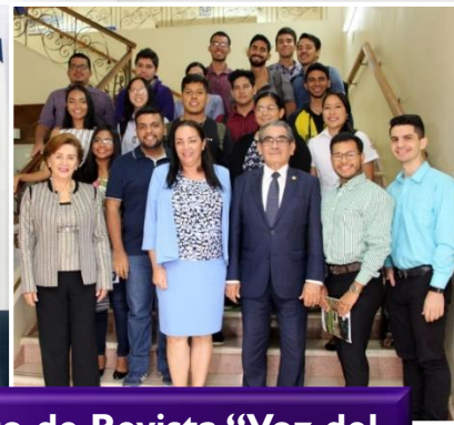
Lanzamiento de Revista "Voz del Estudiante".