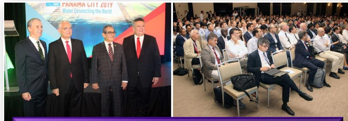
Congreso Mundial del Agua (IAHR 2019)

El Presidente de la República de Panamá, se reunió con más de 500 jóvenes, representantes de las distintas regiones educativas del país, en el Teatro Auditorio de la UTP.