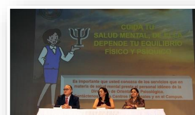
Jornada de Salud Mental, en el año de Prevención de Salud.