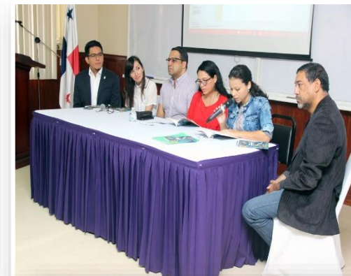
VI Congreso Internacional de Literatura.