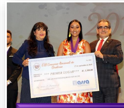
VIII Concurso Nacional de Oratoria - UTP

50 estudiantes de la UTP fueron beneficiados con un Programa de Becas del IFARHU, que les permitirá realizar estudios del idioma inglés, en países como: Canadá, Estados Unidos, Inglaterra e Irlanda.