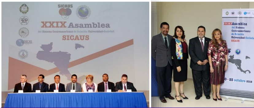
Inauguración de XXIX Asamblea del SICAUS (Sistema Centroamericano de Relación Universidad – Sociedad).