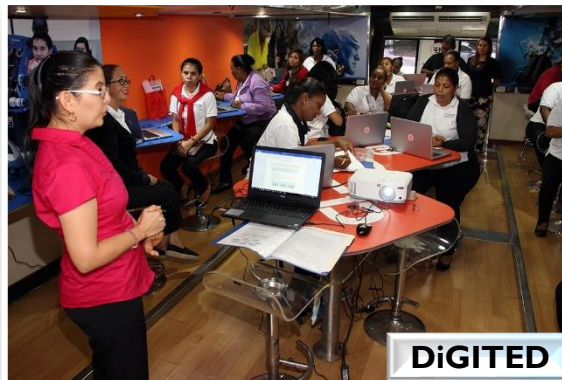
Capacitación en Informática Básica, para 19 madres en estado de riesgo social.