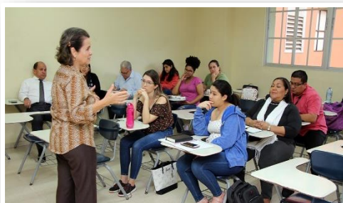
Programa de Evaluación Nutricional, a estudiantes.