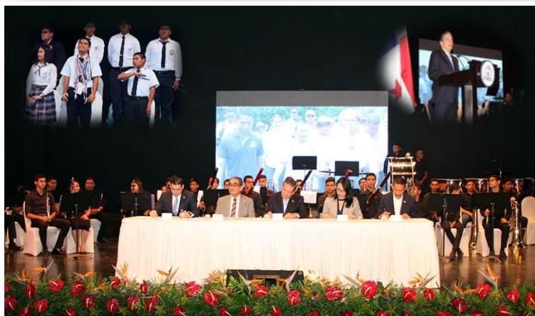
Primer Encuentro Nacional de Estudiantes

Evento que se desarrolla con el objetivo de fomentar el desarrollo de la informática en la región y apoyar en la transferencia tecnológica, innovación, investigación y docencia en informática.