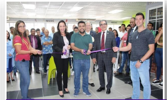
Reinauguración de Kiosco en la FIE.