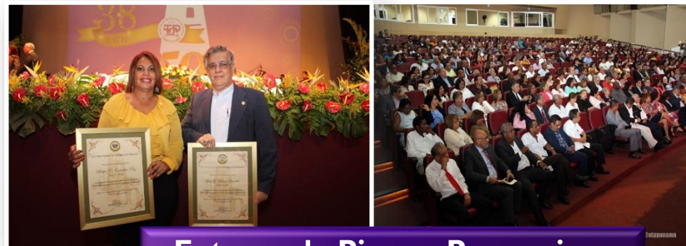
Entrega de Pines y Pergaminos