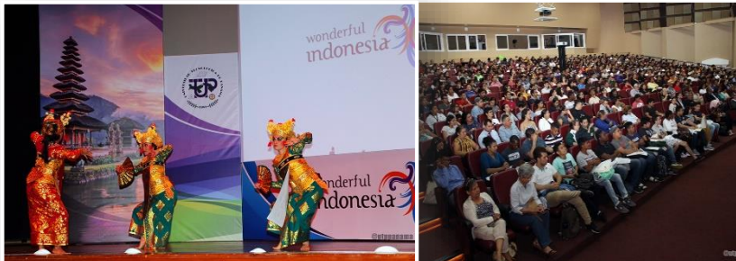
“Wonderful Indonesia” y presentación de la Conferencia: “El Sistema Educativo de Indonesia y Oportunidades de Estudio”.