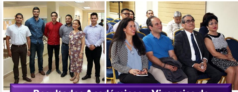
Resultados Académicos y Vivencias de Programas de Movilidad Internacional 2019.