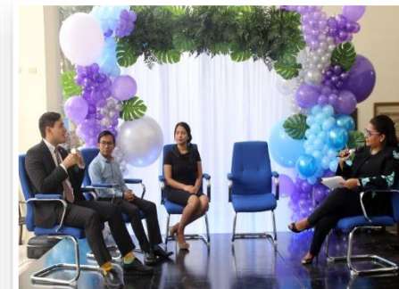
Semana de Valores.