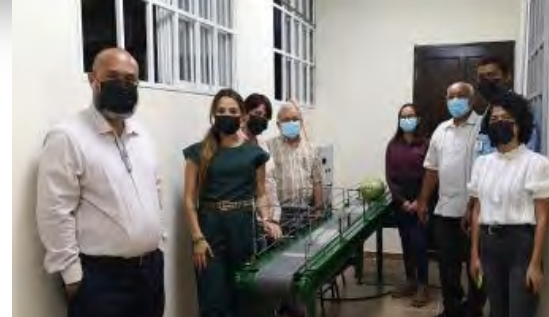
Laboratorio de Procesos Agroindustriales en C.R. Azuero