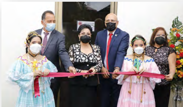
Laboratorio de Tecnología 4.0 en C.R. Veraguas