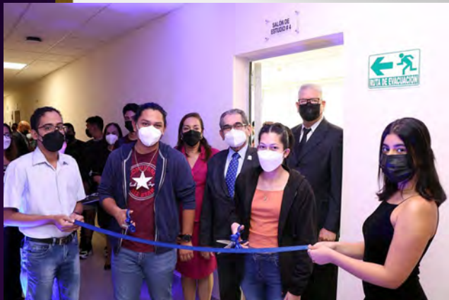
Inauguración de los salones de estudio No. 1 y No. 4, en el piso 3 del Edificio de Facilidades Estudiantiles