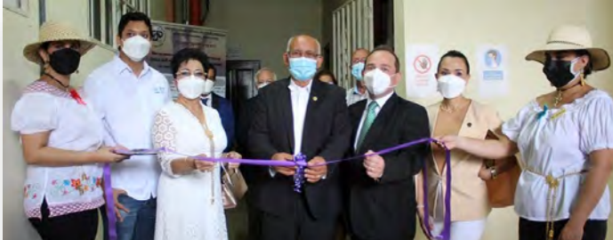
Laboratorio de Tecnologías de la Información y Comunicación (TIC) para el Monitoreo Ambiental en C.R. Azuero