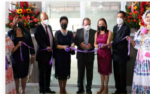
Centro de Fabricación Digital (Fab-lab) en C.R. Chiriquí