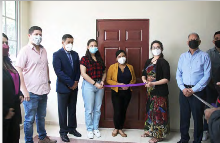
Salón de Trabajo para los estudiantes de la Maestría Científica en Recursos Hídricos