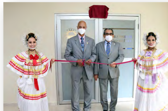
Laboratorio de Tecnología 4.0 en FIM – Sede Central