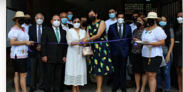
Centro de Fabricación Digital (Fab-lab) en C.R. Azuero