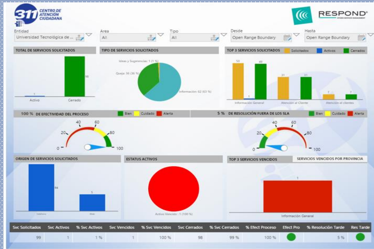
Panel Ejecutivo del Centro de Atención Ciudadana del 311 de la AIG del mes de diciembre.

Dirección de Auditoría Interna y Transparencia.