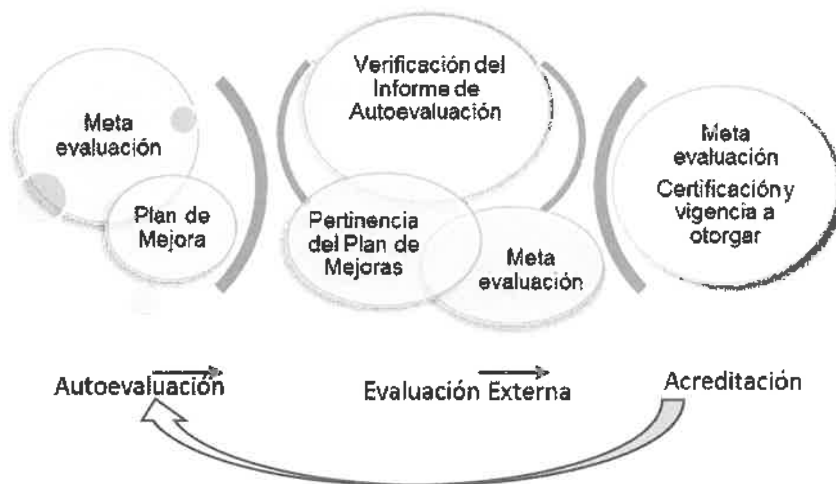
Figura 1. Fases del Modelo de Acreditación universitaria.

La Figura 1, ilustra las fases del proceso de acreditación.