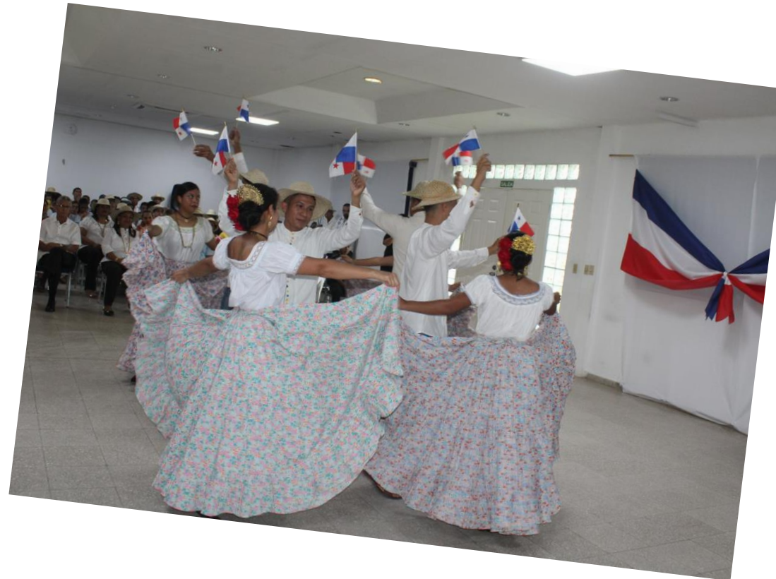
Centro Regional de Coclé