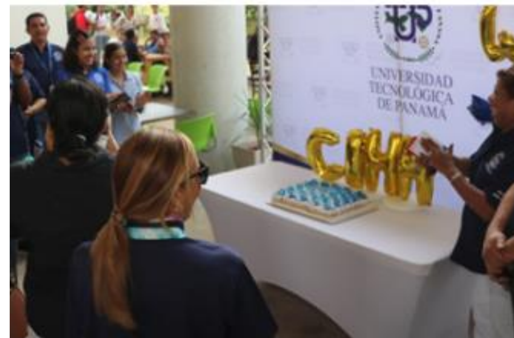
El CIHH celebró sus 45 años