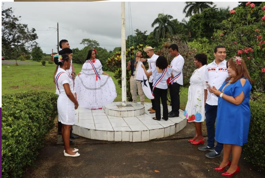
Centro Regional de Colón