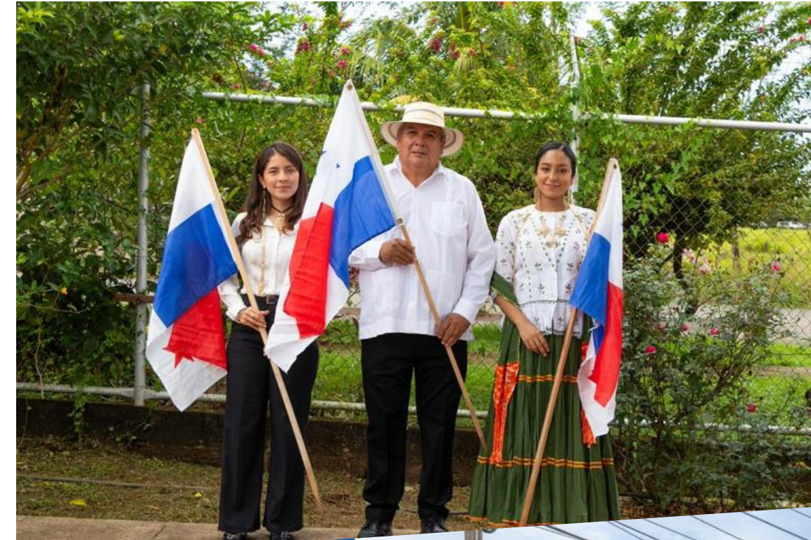
Centro Regional de Veraguas