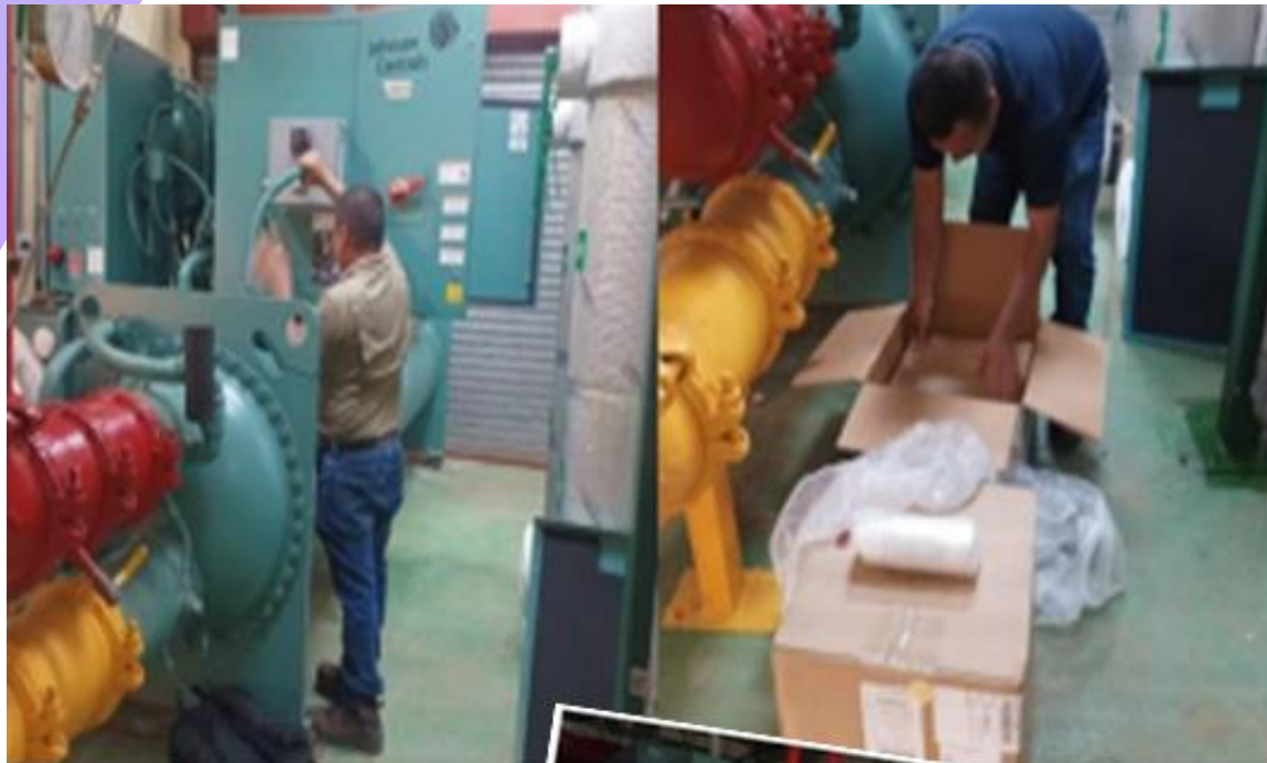
Mantenimiento de Chillers