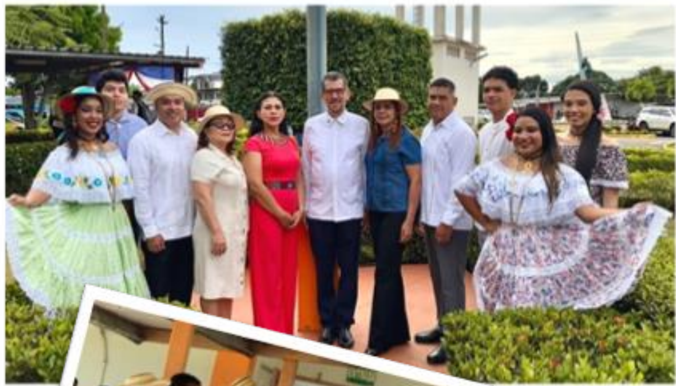
Centro Regional de Panamá Oeste