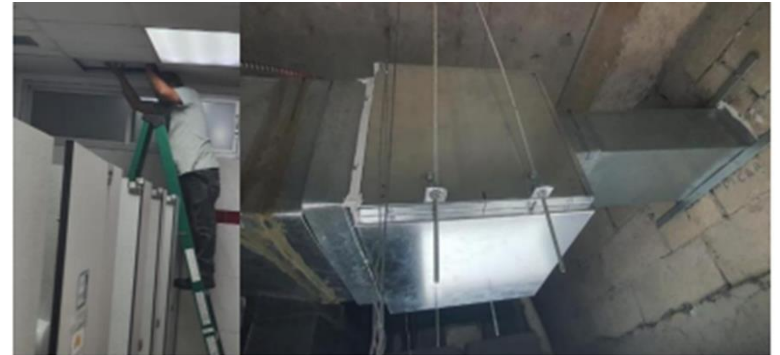
Instalación de extractor en baños del Edificio 2