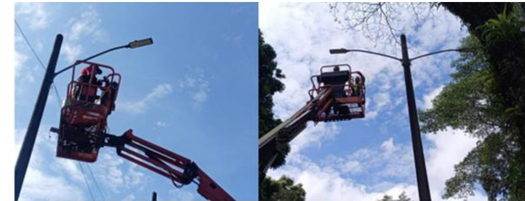
Imagen 9: Desinstalación de luminarias antiguas