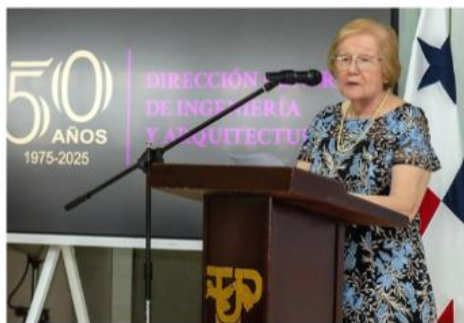
50° aniversario de la DGIA