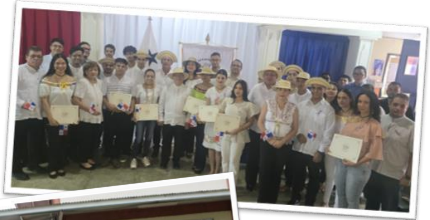
Centro Regional de Azuero