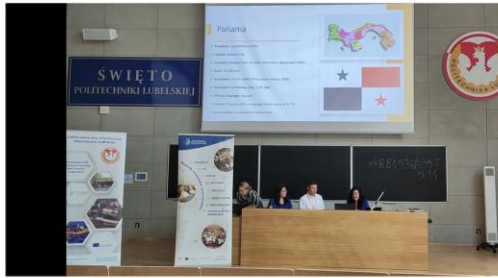
Sesión de Conferencias Investigadores-Doctores Universidad Tecnológica de Panamá Representantes del Staff Mobility Erasmus+ Programme Lecture Hall A1 LUT University Campus