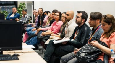
Sesión de Conferencias Centre of Scientific & Technical Information Centro de Innovación y Tecnologías Avanzadas LUT - Polonia