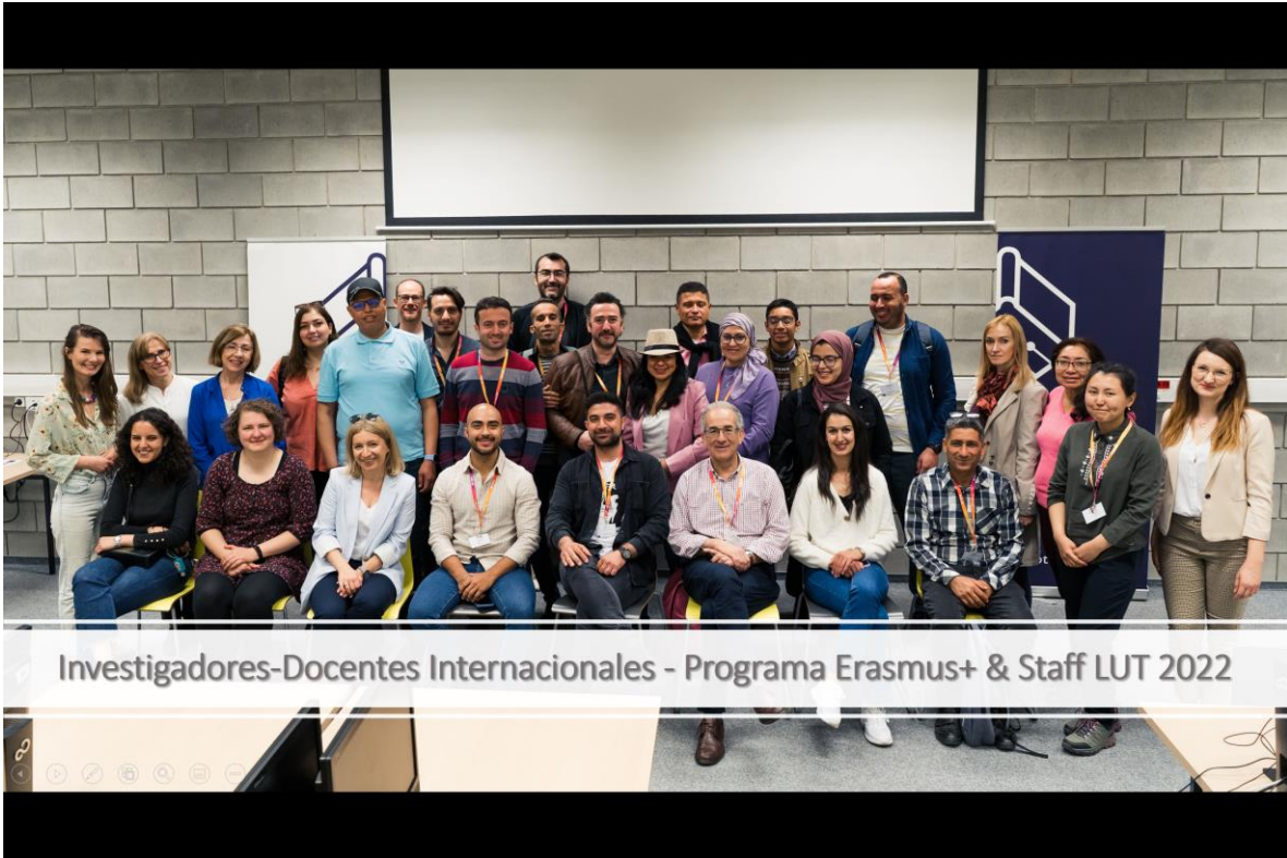
Investigadores-Docentes Internacionales - Programa Erasmus+ & Staff LUT 2022